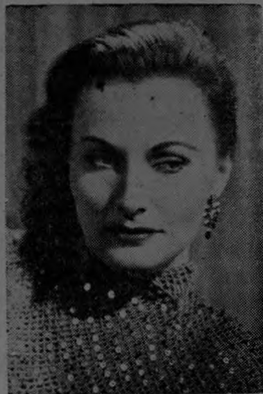
Al admirar la belleza de la adorable Florence Marly, estrella de Allied Artists, puede uno darse cuenta inmediatamente de que dedica la mayor atención al cuidado de todos sus detalles, según afirma Max Factor Jr., el famoso experto de Hollywood.

Cystex Para Reumatismo, Riñones y Vejiga